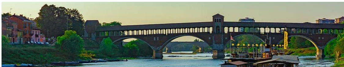
Statistics and Data Science Conference